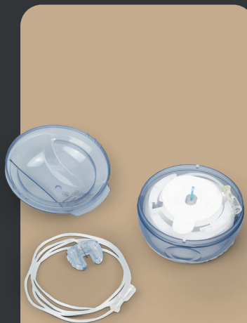
Dana Inset II