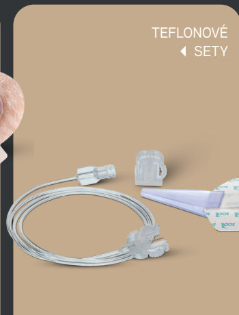
Soft release ST